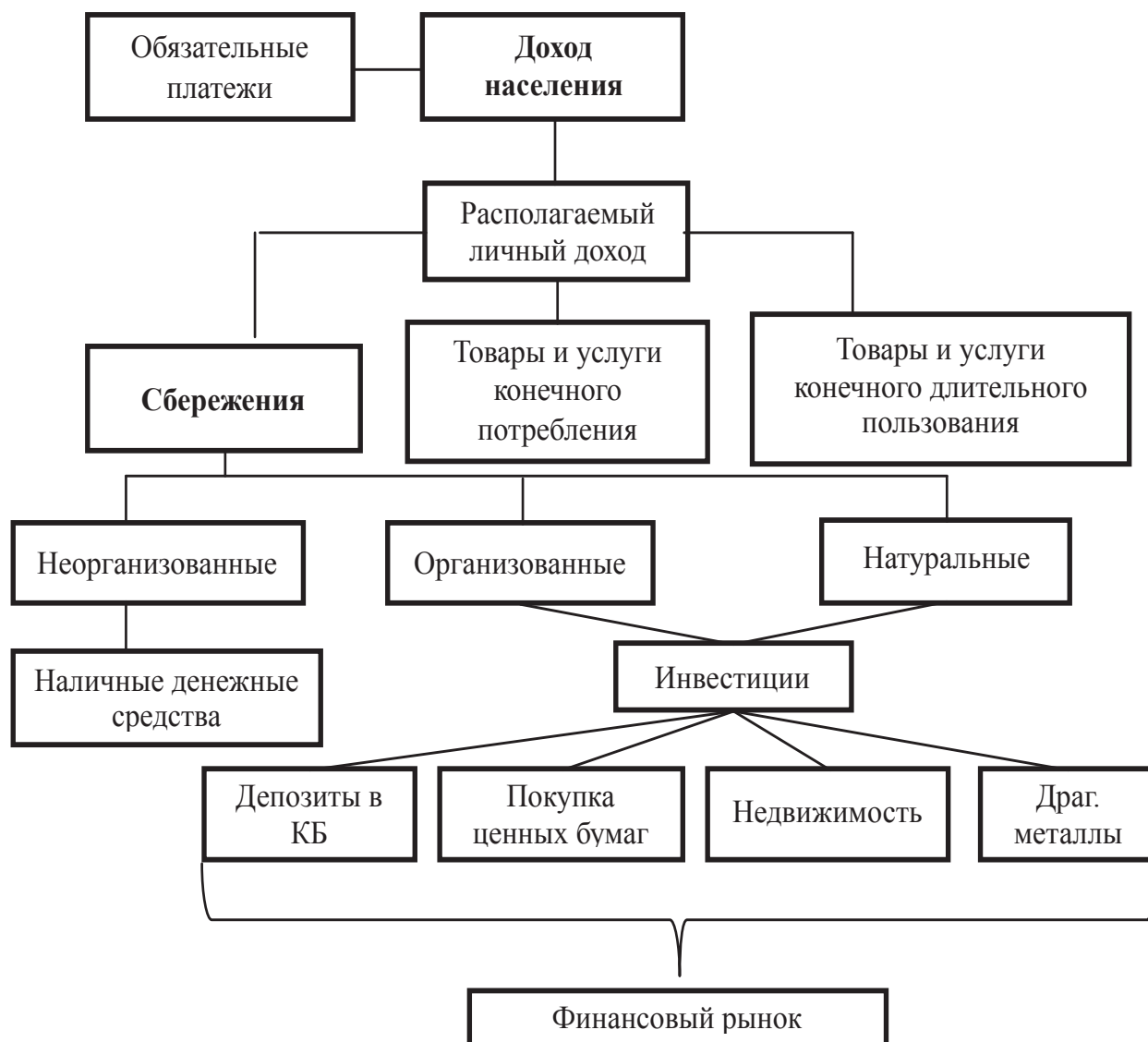
Рис. 1. Процесс трансформации сбережений населения в инвестиции