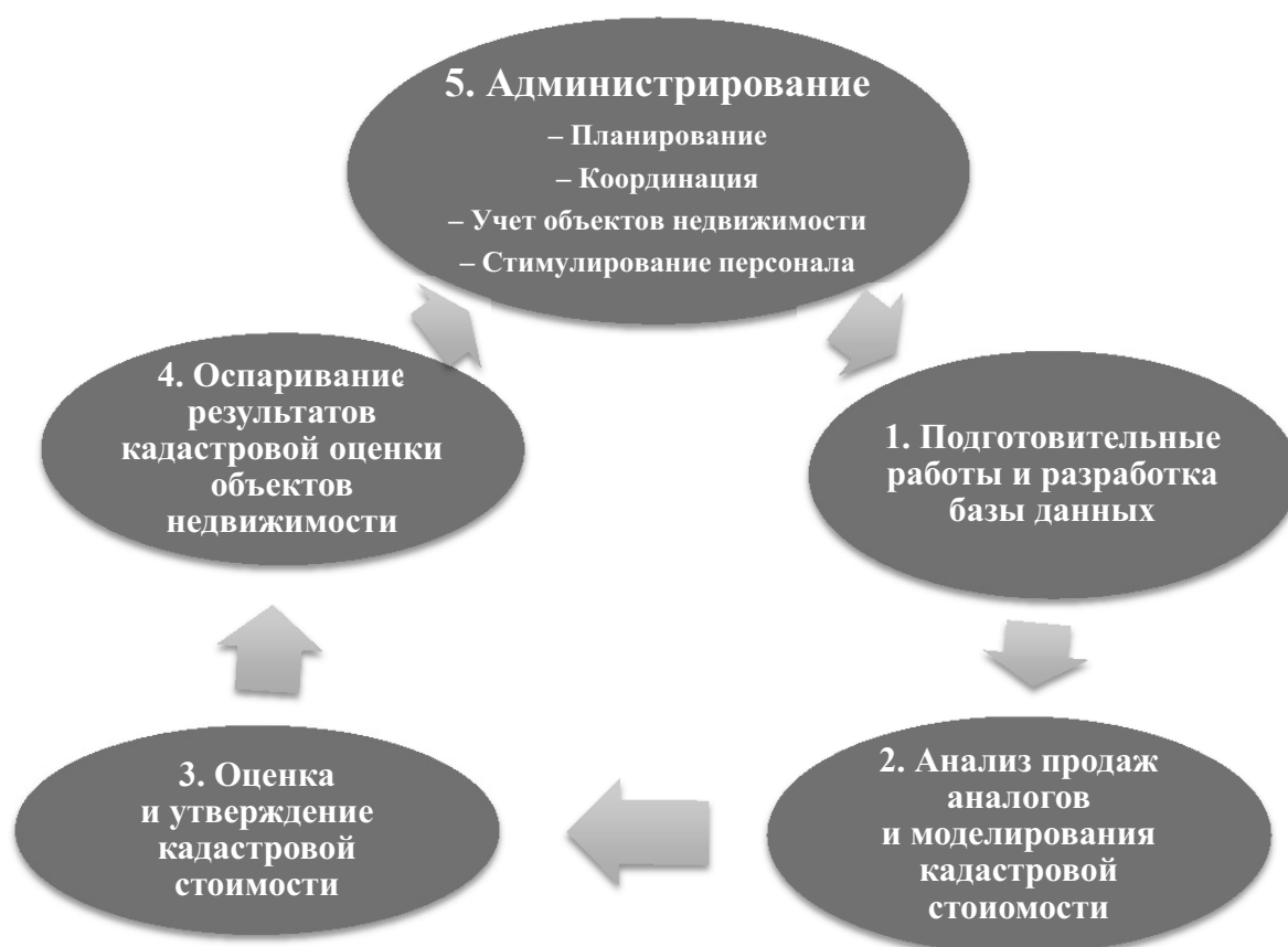
Рис. 2. Общие функции государственной кадастровой оценки недвижимости

Все эти общие функции ГКО мог бы реализовывать Росреестр, так как в нашей стране, в отличие от других государств, сложилась уникальная благоприятная ситуация, когда в одном государственном органе сконцентрированы все основные подготовительные функции ГКО недвижимости. И этой ситуацией необходимо обязательно воспользоваться.