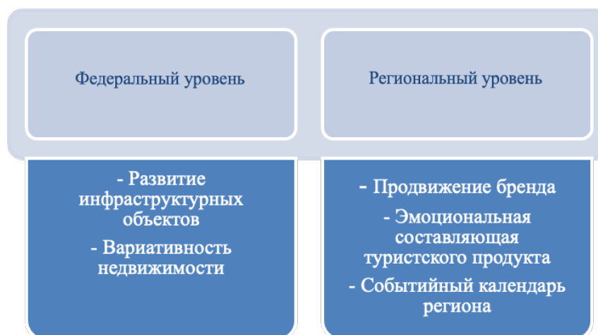
Рис. 4 / Fig 4. Составляющие маркетингово-девелоперской модели развития туристской территории / Components of the Marketing and Development Model for Tourism Territory Development

Большое значение уделяется созданию позитивного имиджа российского туризма через брендинг туристских территорий. Маркетинговое позициони-