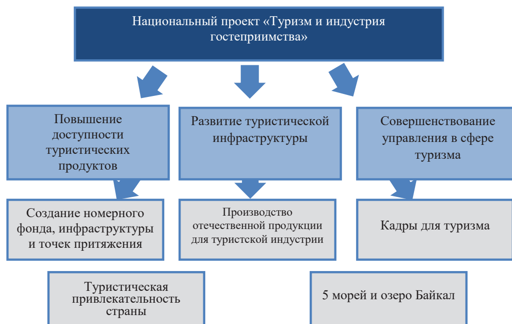
Рис. 2 / Fig. 2. Структура национального проекта «Туризм и индустрия гостеприимства» / Structure of the National Project "Tourism and the Hospitality Industry"